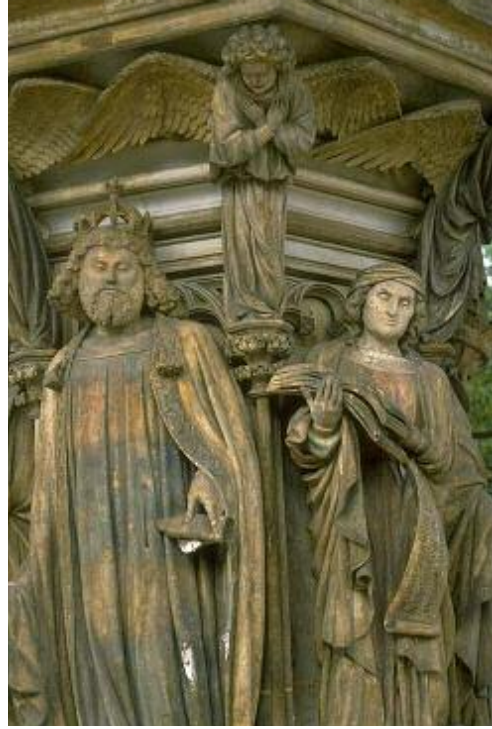
كلاس سلوتر Klass Sluter